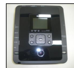
↑DVDライター ビデオカメラの画像を DVDにします。