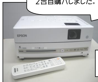
←DVD 一体型 プロジェクター