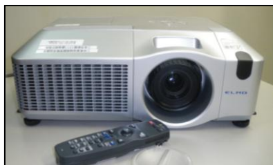
↑5000 アンシル-MXの体育館用 プロジェクター学校行事で ご利用ください。