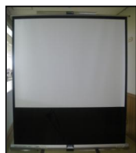
↑100インチ E8"イルスクリーン