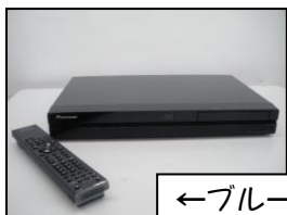
←ブルーレイプレーヤー 《21年度末、購入ご利用ください》