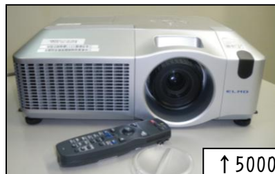
↑5000 アンシル-メン 体育館用プロジェクター 学校行事にご活用ください!