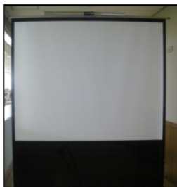
↑100インチ モバイルスクリーン (新タイプ)