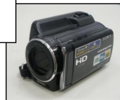
→ソニーHD デジタビデオ カメラ。HDに録画します 三脚もあります。