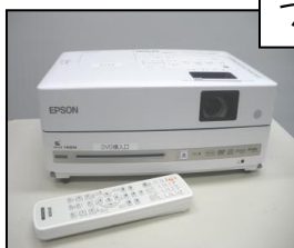
←DVD 一体型 プロジェクター